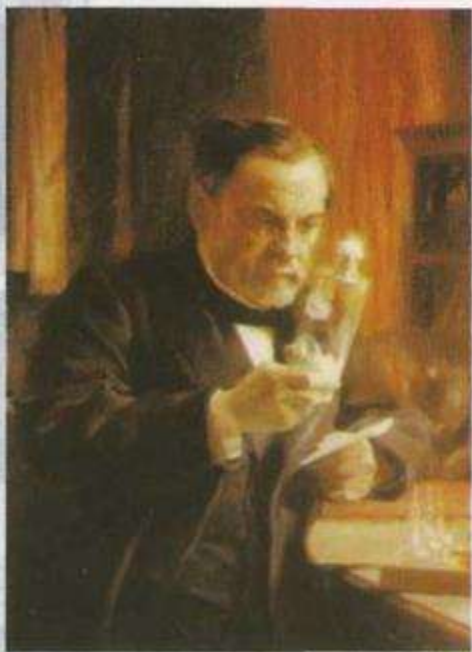
Луи Пастер (1822-1895 гг.)

В XVIII веке было предсказано, что природу заразных болезней раскроет тот, кто объяснит природу брожения. Таким человеком стал Луи Пастер. Он опроверг гипотезу самопроизвольного зарождения микроорганизмов (1860 г.), доказал экспериментальным путём возможность формирования искусственного иммунитета (1870 г.).